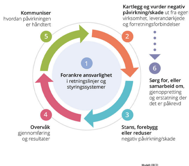
Figur 2: OECDs 6-stegsmodell for aktsomhetsvurderingsprosessen. (Figuren er hentet fra OECDs veileder for aktsomhetsvurderinger for ansvarlig næringsliv, 22.05.2023).

Foreliggende rapport er utarbeidet i samsvar med OECDs aktsomhetsmodell for vurdering av ansvarlig næringsliv (OECD, 2019). Rapporten er bygd på de seks ulike stegene som fremkommer av modellen (Figur 2).