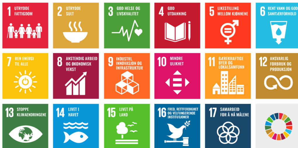
Figur 1: FNs bærekraftsmål

Bertheussen IT ønsker å bidra til å ivareta og styrke FNs bærekraftsmål. Vi anerkjenner vårt ansvar med å bidra til en bærekraftig utvikling for næringslivet og sivilsamfunnet. Foreliggende rapport treffer innenfor flere av FNs bærekraftsmål, herunder å utrydde fattigdom, god helse, likestilling mellom kjønnene, rent vann og gode sanitærforhold, anstendig arbeid og økonomisk vekst, mindre ulikheter, fred og rettferdighet, og samarbeid.